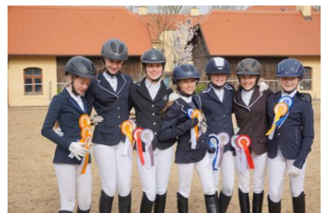
07./08. Juli 2018 Reitturnier mit schwäbischen Ponymeisterschaften