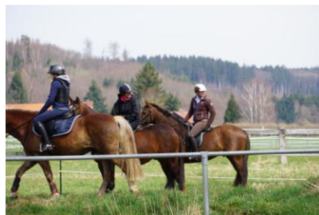
06. April 2018 Reitabzeichen