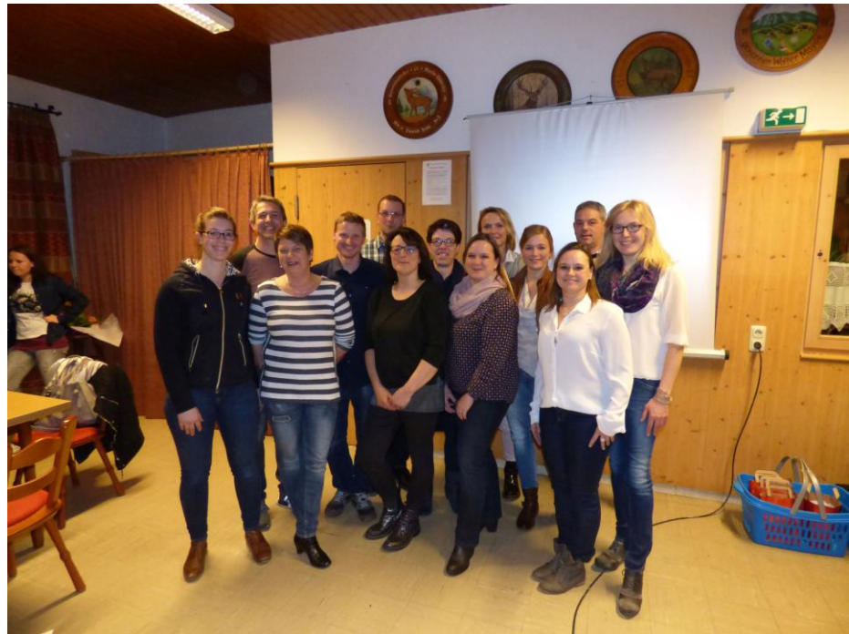
12./13. Mai 2018 Vierkampf und Jugendturnier