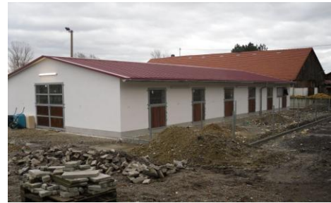
Bau des Stalles neben dem Dressurplatz

03./04. Oktober 2009 Voltigierturnier und Breitensportliche Veranstaltung/Voltigiertag in Schwabmünchen